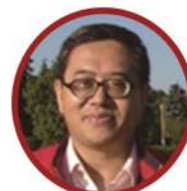
李超杰 北京大学哲学系教授 哈佛大学和柏林洪堡大学访问学者