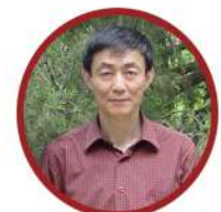
阎步克 北京大学历史学系教授 北京大学人文学部副主任