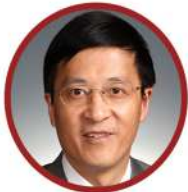
陆正飞 光华管理学院会计系教授 教育部长江学者特聘教授