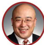
陈玉宇 光华管理学院应用经济学系教授 北京大学经济政策研究所所长 国家自然科学基金杰出青年奖 教育部长江学者特聘教授